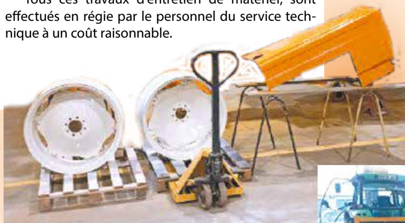
Roues du tracteur sortie de peinture