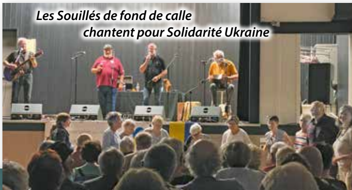
Les Souillés de fond de calle chantent pour Solidarité Ukraine