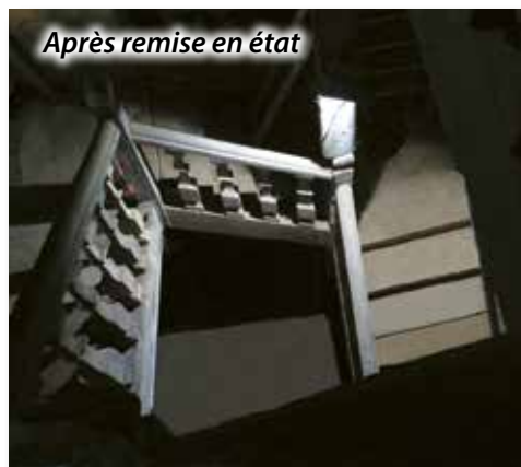
Après remise en état