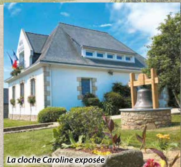
La cloche Caroline exposée