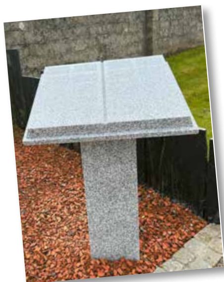
Pupitre du Souvenir de l'Armor

Comme nous vous l'avions annoncé dans le précédent bulletin, les pupitres ont été installés par les services techniques de la ville, dans les jardins du souvenir de PLEUBIAN et de L'ARMOR.