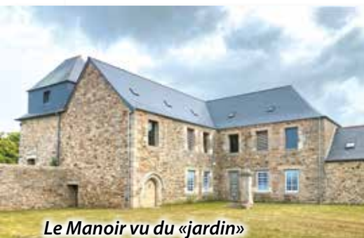
Le Manoir vu du «jardin»