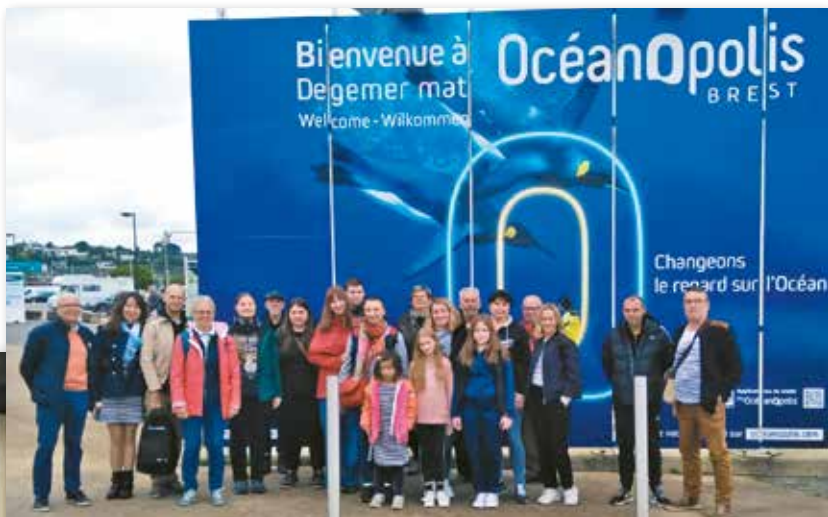
Découverte d'Océanopolis, pour 10 réfugiés ukrainiens accompagnés de bénévoles. Ce 7 mai, une journée très appréciée, rendue possible par le soutien de la mairie de Pleubian qui a pris en charge une partie des frais de transports.