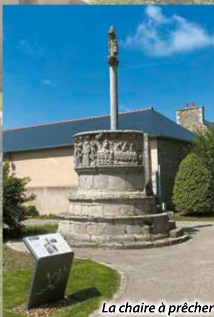
La chaire à prêcher