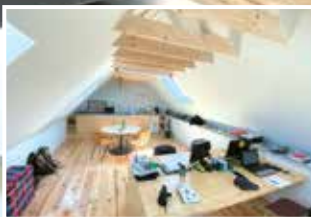
Salle de réunion

Cet investissement de près de 500 000 € a été entièrement financé par le conservatoire avec l'aide du plan de relance de l'état (400 000 €), la commune apportant son aide technique.