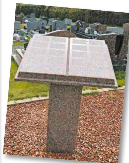
Pupitre du Souvenir de Pleubian

Les renseignements et démarches sont à prendre et à faire en mairie.