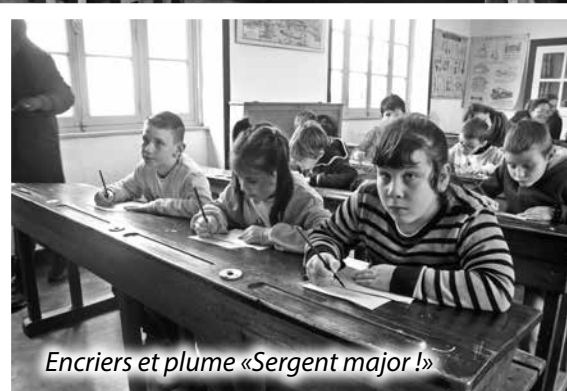
Encriers et plume «Sergent major !»