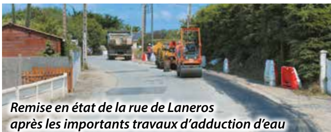
Remise en état de la rue de Laneros après les importants travaux d'adduction d'eau