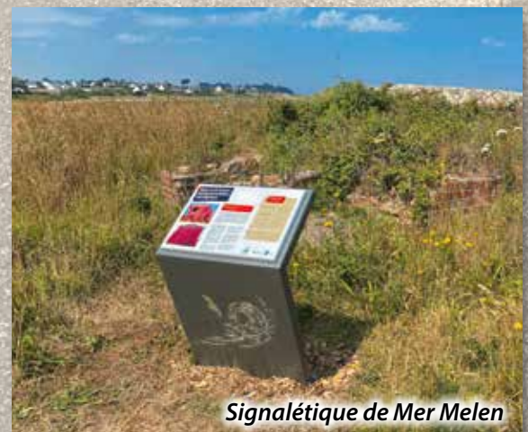
Signalétique de Mer Melen