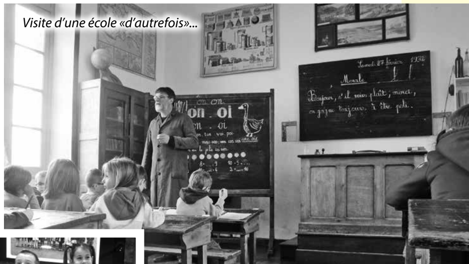
Visite d'une école «d'autrefois»...