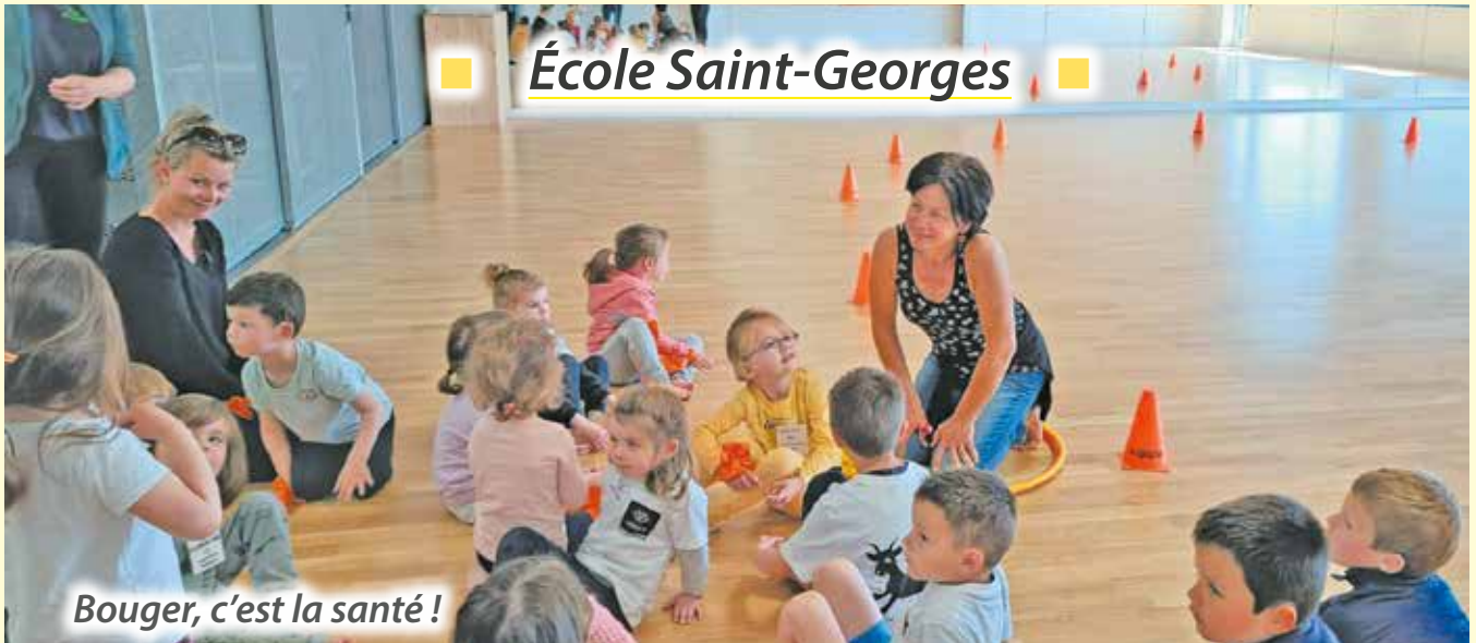
Bouger, c'est la santé !

A un an des jeux olympiques de Paris 2024, le sport a rythmé la deuxième période de l'année des enfants.