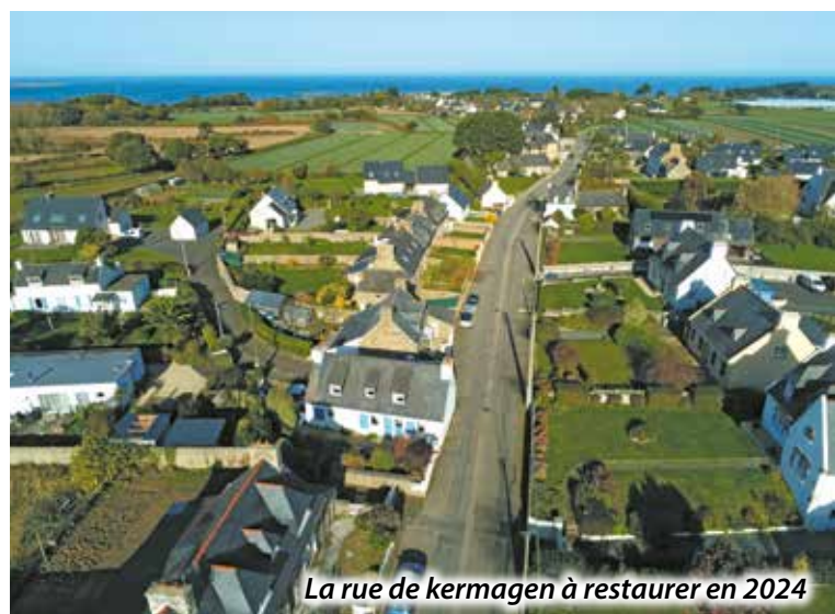
La rue de kermagen à restaurer en 2024

Un gros budget à prévoir ..... 400 000 €.