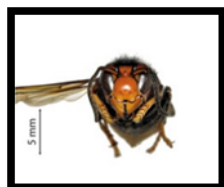
Frelon asiatique vu de dos et de face