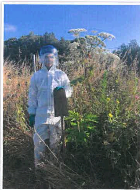
Berce du Caucase en plus de 2 mètres de haut

Pour aller plus loin : Via ce lien, vous trouverez le moyen de lutte pratiqué par la FREDON Bretagne lors des campagnes d'arrachages qui ont lieu de mai à juin : http://www.fredon-bretagne.com/comment-lutter-contre-la-berce-du-caucase/