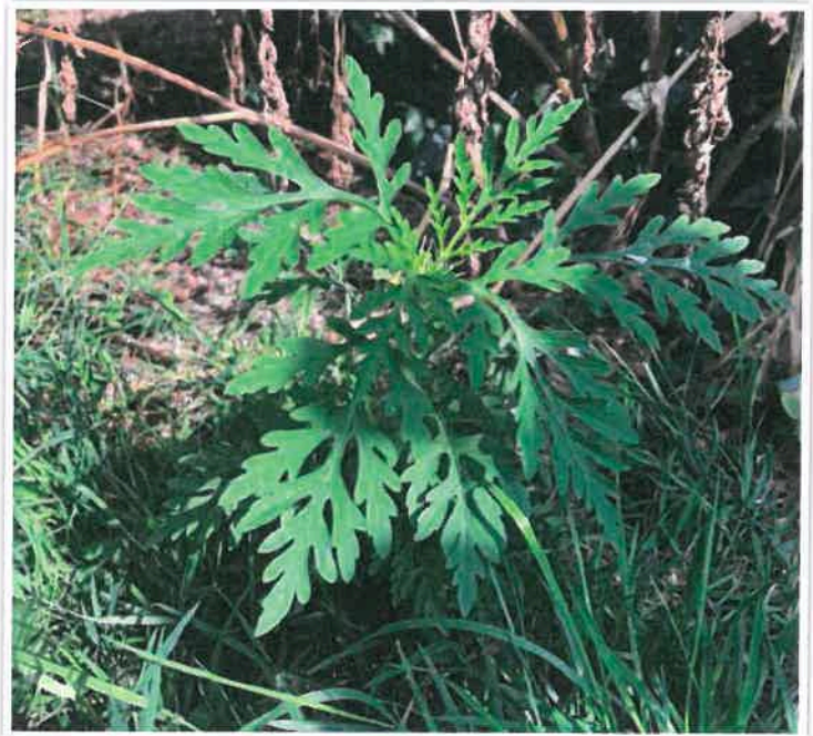
Jeune plant d'ambroisie à feuille d'armoise, à Vannes le 25 juin 2020.

Au moindre doute, n'hésitez pas à prendre en photo la plante et à envoyer toutes les informations dont vous disposez à la FREDON Bretagne.