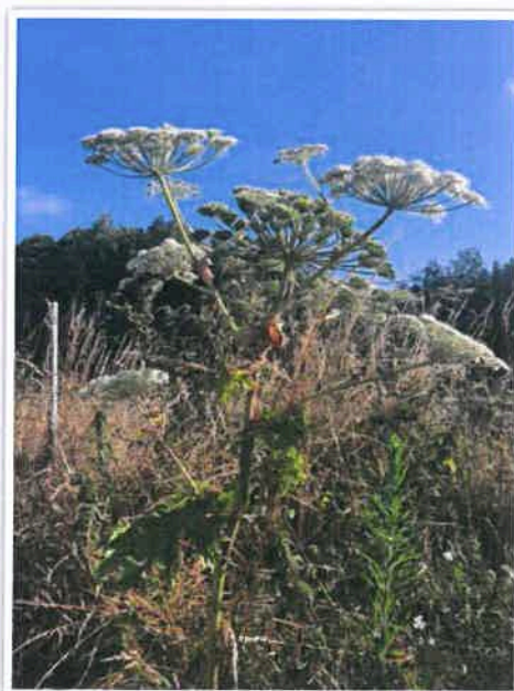
Ombelle florale de la berce du Caucase.

Ille-et-Vilaine le 3 juillet 2020